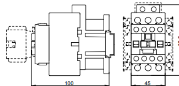
BA47 MC-25~38D (катушка управления AC)